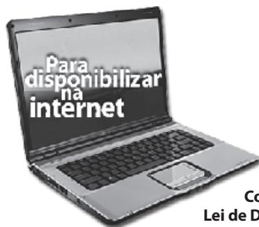
Cartilha sobre Direitos Autorais Convenção Universal Lei de Direitos Autorais/ Constituição

Agora você já sabe como ser um pesquisador. Pratique essa idéia em cada um de seus trabalhos acadêmicos, incluindo a sua monografia, e, para esclarecer qualquer dúvida quanto à forma correta de redação, converse com seu professor ou com a própria Comissão para Avaliação de Autoria.